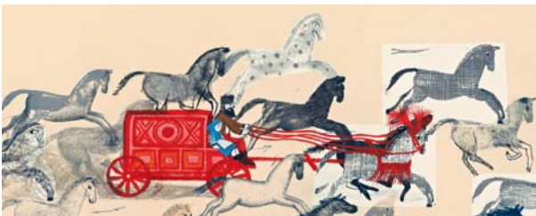
Valerio Vidali, Nel Bosco della Baba Jaga, Fiabe dalla Russia, Franco Cosimo Panini

I racconti della mostra ci guideranno in un viaggio attorno al mondo. Esploriamo in chiave ludica popoli, culture, riti, parole, tradizioni culinarie. Lasciamoci trascinare dai racconti per inventarne altri. Intrecciamo colorati fili di storie, peculiarità, immagini, ricordi lontani di paesi diversi per tessere una tela variopinta e possibile.